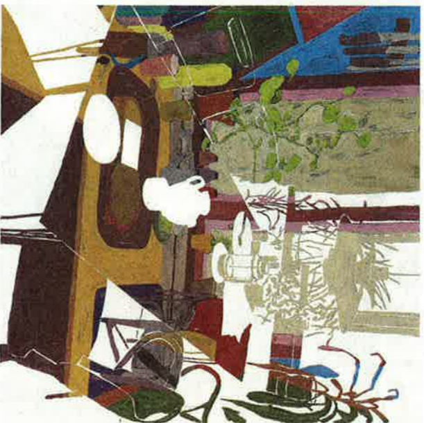
Uden titel, Kaspar Bonnén, 2011