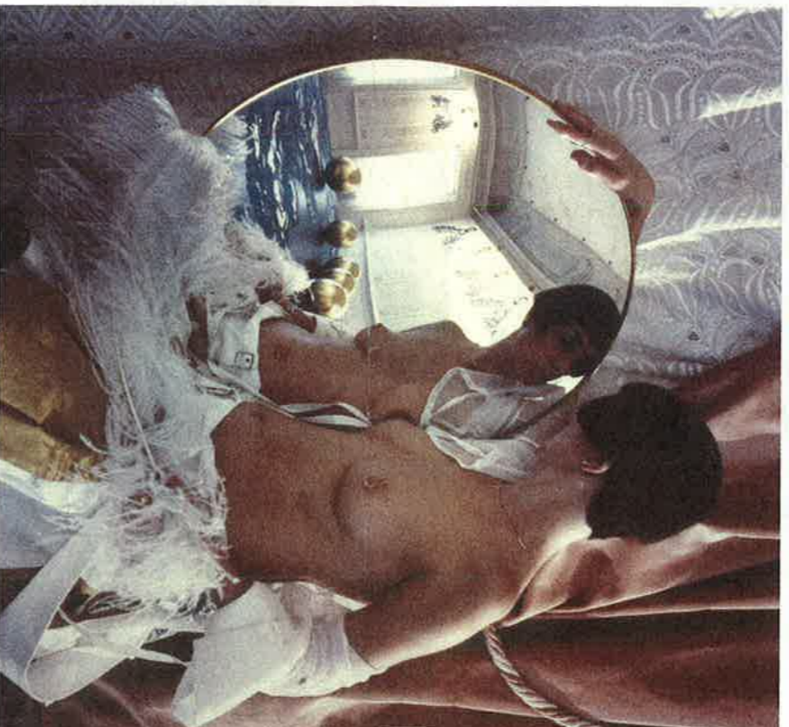
Helen Chadwick, Vanitas II, 1986, C-print, National Portrait Gallery, London