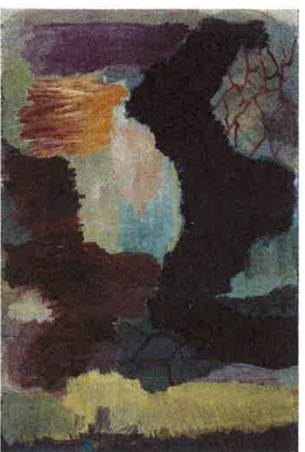
Per Kirkeby, Læsa, 1992, Kirkeby Epifani, Ny Carlsberg Glyptotek