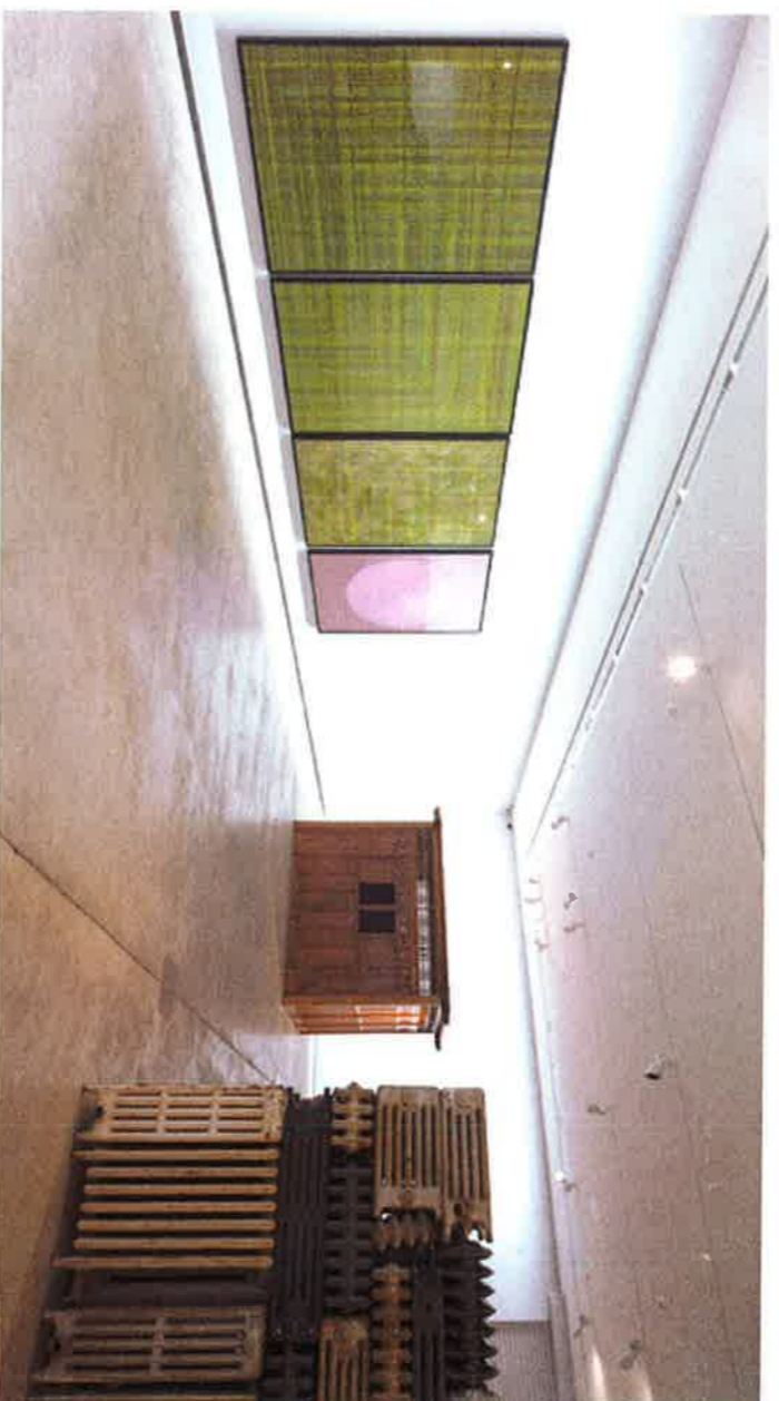
India: Art Now , 2012. Installationsviev med værker af Bharti Kher Foto: Anders Sune Berg.